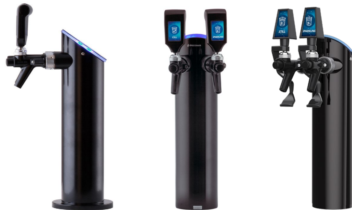
Fixing base finns som tillval.