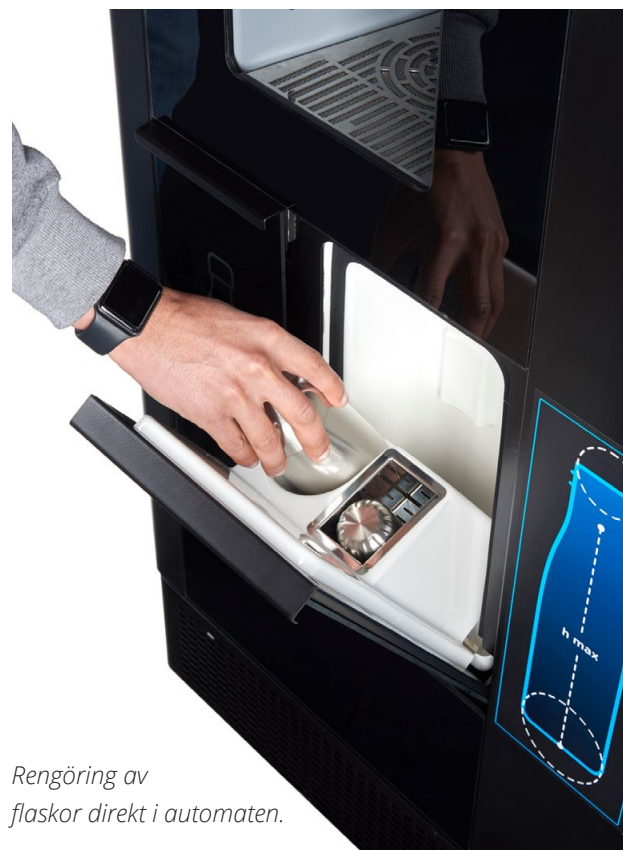
Rengöring av flaskor direkt i automaten.